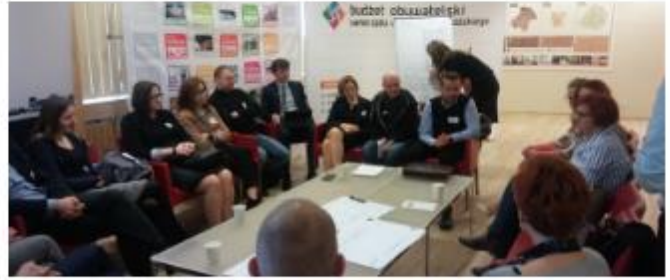
Lodzas reģiona piektā ieinteresēto pušu sanāksme